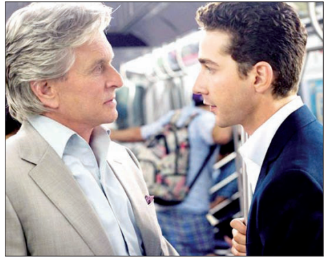
Mit der Vorpremiere von „Wall Street – Geld schläft nicht“ präsentiert CineStar die mit Spannung erwartete Fortsetzung des Kulturthrillers von Oliver Stone – in der Hauptrolle der brillante Michael Douglas alias Gordon Gekko.

Für alle Kinofans, die den Bundesstart nicht abwarten wollen, präsentiert CineStar „Wall Street – Geld schläft nicht“ bereits einen Tag vor offiziellem Starttermin. CineStar freut sich auf zahlreiche Besucher und wünscht allen Kinogästen spannende Unterhaltung mit der Vorpremiere.