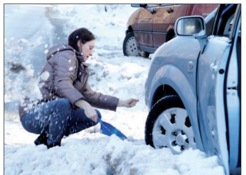
Autofahrer, die nicht von schnee- oder eisglatten Straßen überrascht werden wollen, sollten jetzt auf Winterreifen umrüsten.

Viele Autohäuser und Reifenhändler bieten auch die Einlagerung der Reifen an.